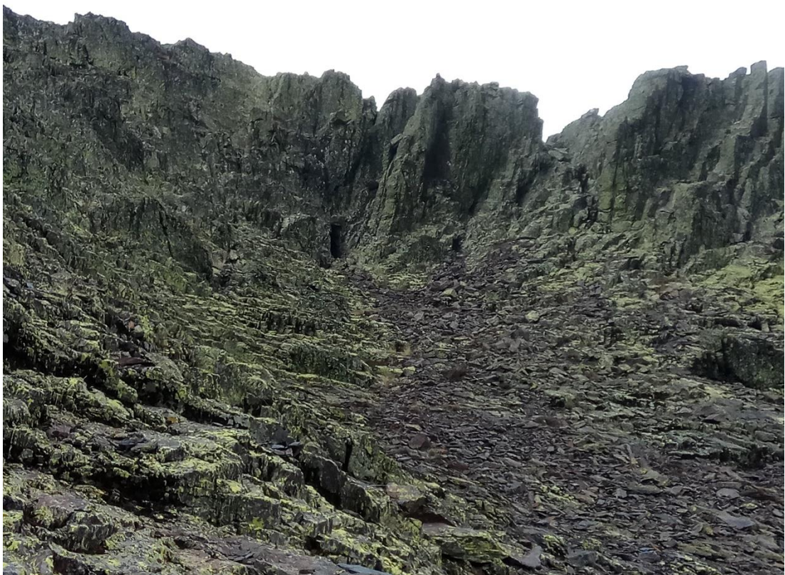
Vivac horadado en la roca