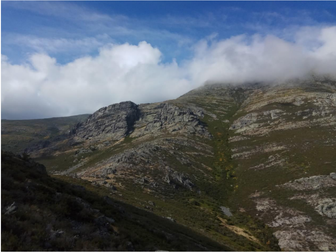
Pico Peñamala y detrás el Ocejón, cubierto de nubes