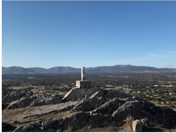
Vértice geodésico "Torcón"

La ruta transcurre por cómodos caminos y senderos, flanqueados principalmente por encinas, y con algunas olivas y almendros tanto en el inicio como al final. Es preciso destacar, que durante gran parte del recorrido transitaremos por la Cañada Real Segoviana. En cuanto a la fauna, además de la presencia de ganado vacuno debido a la explotación ganadera de la zona, es muy frecuente divisar aves rapaces, especialmente águilas y milanos.