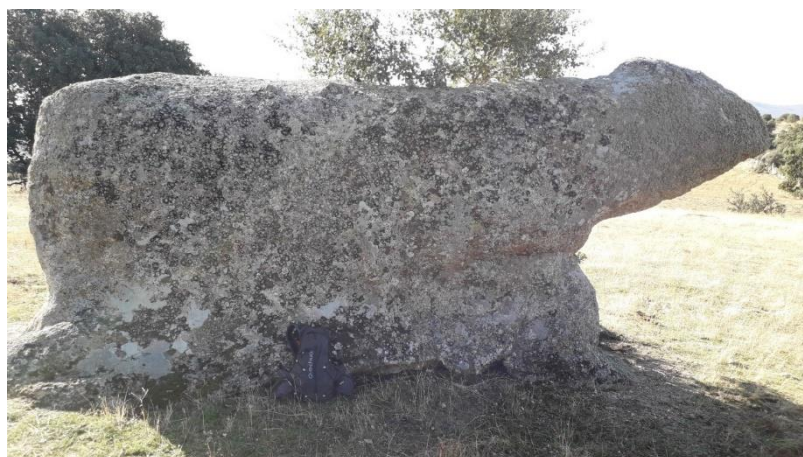
Toro de Menasalbas

El que nos vamos a encontrar, podría corresponder a la forma y tamaño de un toro, aunque la palabra verraco significa “cerdo padre”. Sus dimensiones son de 5 metros de longitud, 2,5 metros de altura en la cabeza, 2 metros de altura en el lomo y 0,90 metros de ancho, este volumen le convierten en un animal grandioso.