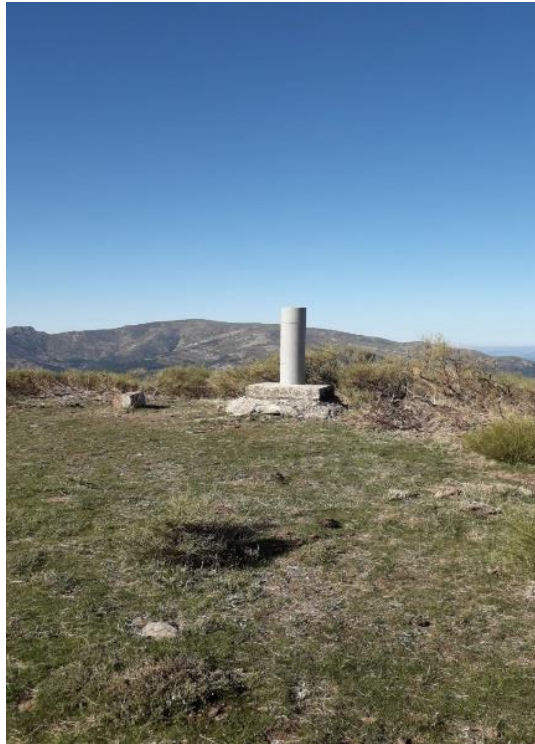
La Parra con La Escusa al fondo