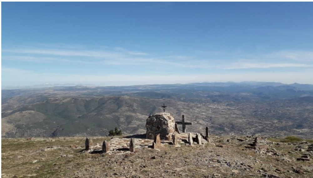
Hornacina con Cebreros y La Merina al fondo